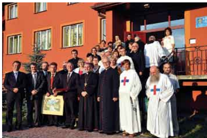
Pamiątkowe zdjęcie przed okazałym budynkiem Centrum.