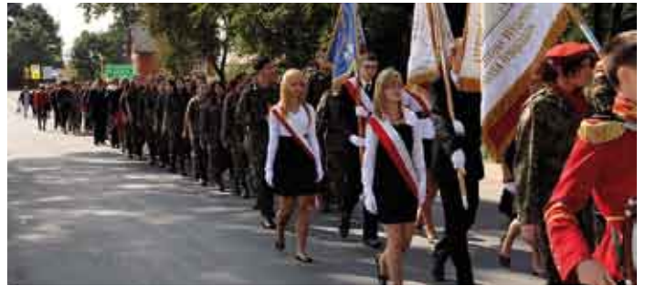
Podczas przemarszu na plac szkolny.