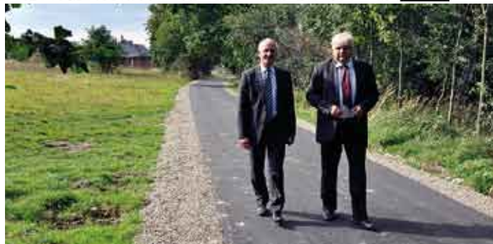
Ulica Poręba w Koniemłotach.

Jednostką koordynującą większość zadań inwestycyjnych na drogach powiatowych jest Zarząd Dróg Powiatowych w Staszowie.