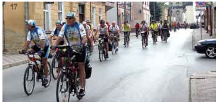
Początek zlotu, przejazd ul. Kościelną w Staszowie.

Tekst: Andrzej Sochacki