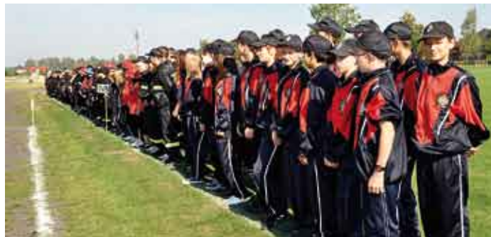
Drużyny biorące udział w powiatowych zawodach sportowo-pożarniczych w Staszowie.