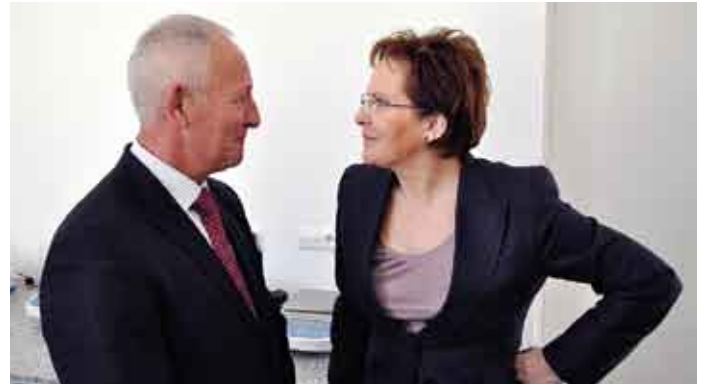
Spotkanie było okazją do przypomnienia pani minister Ewie Kopacz sprawy starań podjętych przez władze powiatu staszowskiego, o dofinansowanie z budżetu państwa w kwocie 7,4 mln zł, zakupu wyposażenia sal w nowo oddanym bloku operacyjnym przy staszowskim szpitalu.

Tekst: Jan Mazanka