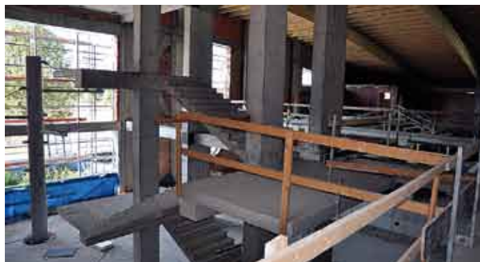
Powiatowe Centrum Sportowe w Staszowie, klatki schodowe, stan prac w dniu 24 września 2011 roku.