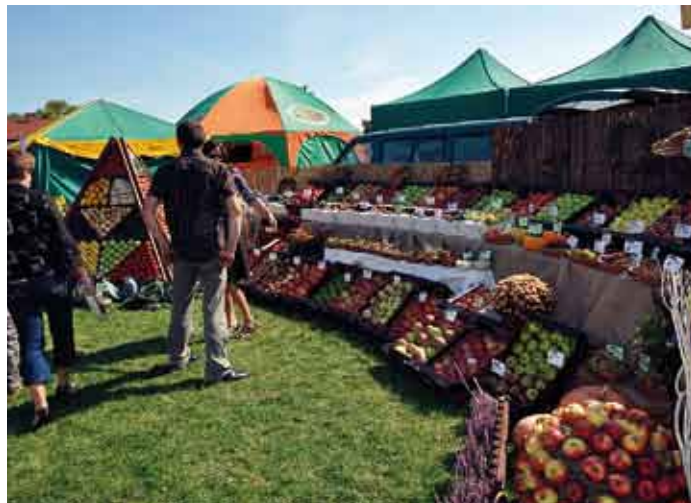
Dożynkom towarzyszyły ciekawie i fachowo przygotowane stoiska.