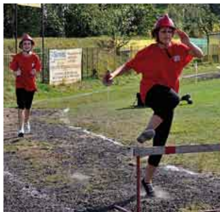
Sztafeta pożarnicza 7x50 m z przeszkodami, zawodniczka MDP ze Zrębina.