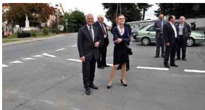
Na placu im. ks. Romana Kotlarza w Koniemłotach.