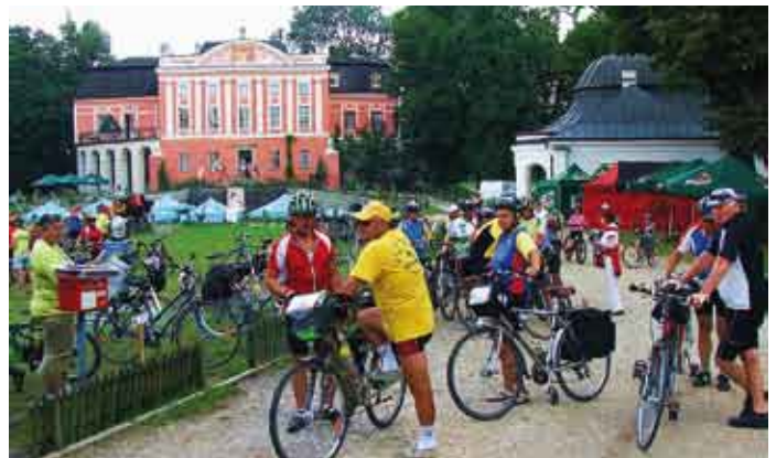
Przed pałacem w Kurozwękach.