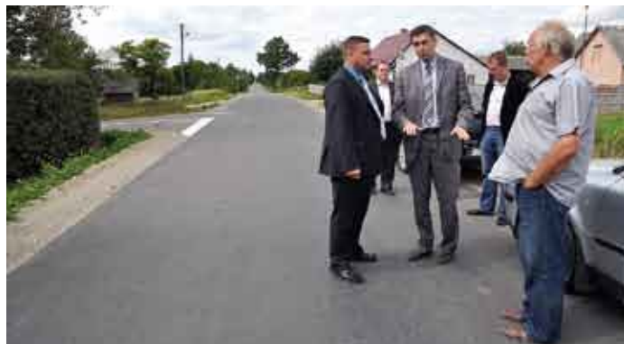
Droga powiatowa z Potoka do Chmielnika we wsi Rudki.