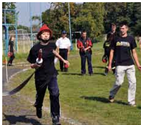
Sztafeta pożarnicza 7x50 m z przeszkodami, zawodniczka KDP z Woli Osowej.