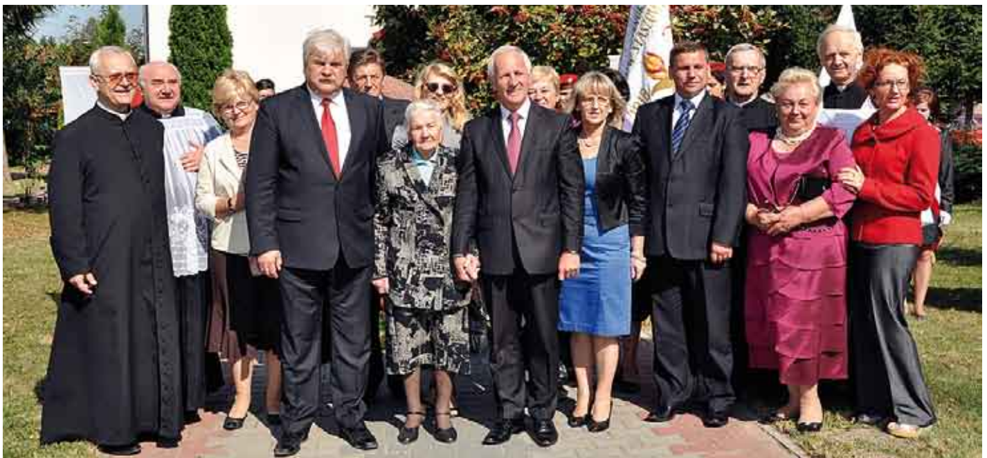
Pamiątkowe zdjęcie po złożeniu kwiatów.