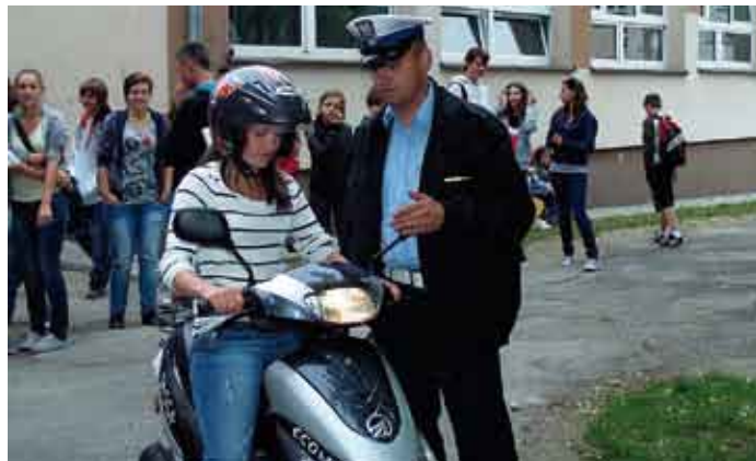
Instruktaż dla dzieci i młodzieży.