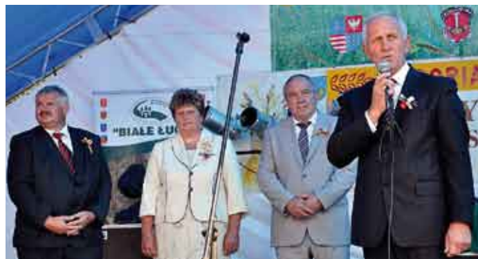
Za trud pracy na roli mieszkańcom wsi ziemi staszowskiej podziękował starosta Andrzej Kruzel.