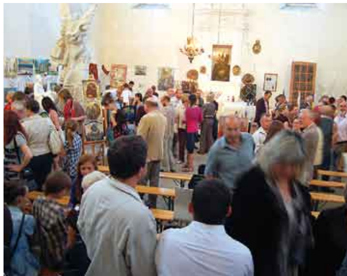
Sceneria szydłowskiej synagogi ubogacała spotkanie.