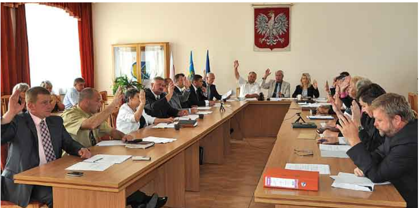
Obydwa projekty uchwał radni przyjęli jednogłośnie.