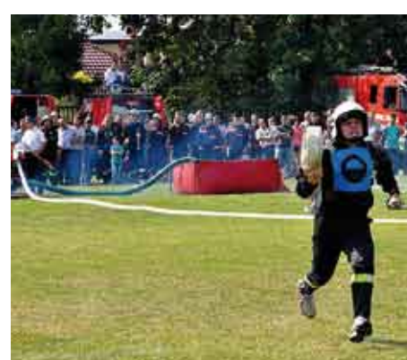
W ćwiczeniu bojowym drużyna OSP seniorów z Wiśniowej.