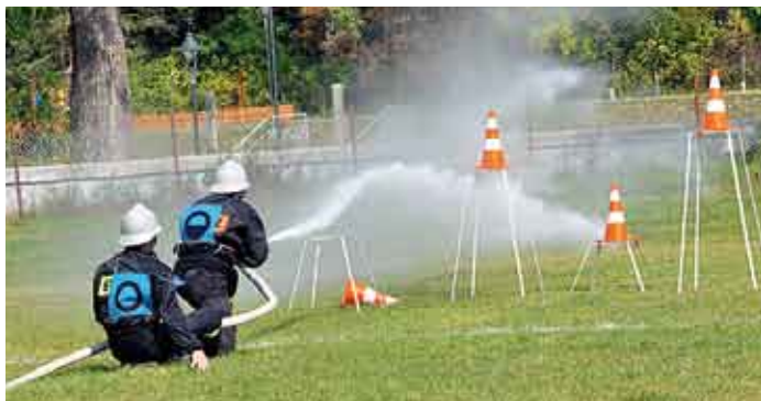
W ćwiczeniu bojowym drużyna OSP seniorów z Sichowa.

konkurencje: sztafetę z przeszkodami 7 x 50 m oraz ćwiczenia bojowe, a ogólna klasyfikacja po zakończeniu zawodów przedstawiała się następująco: