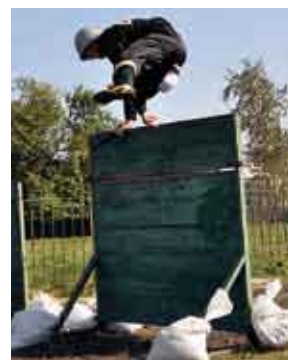
Sztafeta pożarnicza 7x50 m z przeszkodami, zawodnik drużyny OSP ze Strzelec.