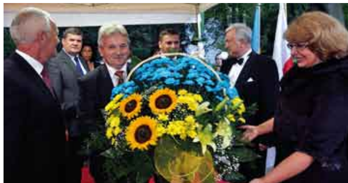
Tradycyjnie kosz niebiesko-żółtych kwiatów wykonała jedna ze staszowskich kwiaciarni.