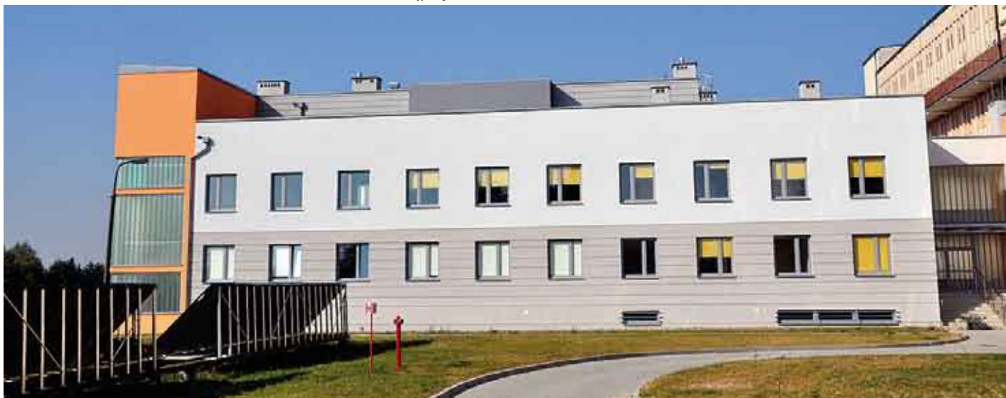
Nowo oddany blok operacyjny przy staszowskim szpitalu, foto z 27.09 2011 r.