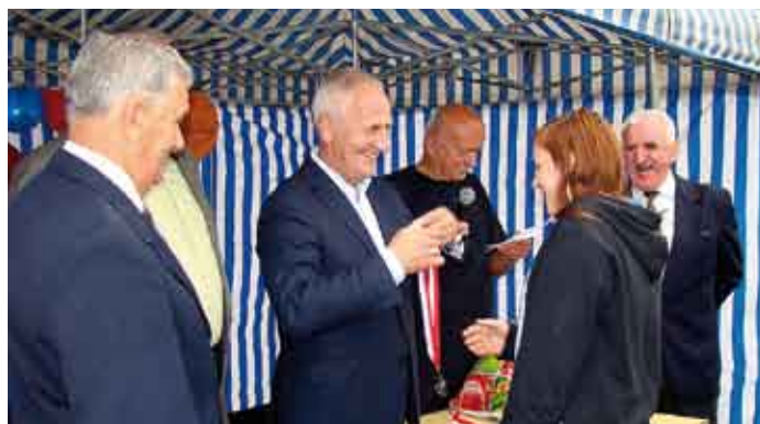
Najlepszych zawodników w rozgrywanych zawodach nagradzano medalami.