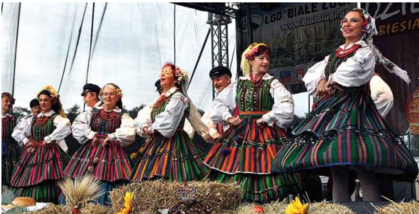
Na scenie „Starachowianie” – Teatr Muzyczny „Nad Kamienną”.

okazją do wyróżnienia 5 rolników z terenu powiatu staszowskiego honorowymi medalami „Za zasługi dla rolnictwa”, a także 11 pracowników administracji medalami „Za długoletnią służbę”. Wraz z medalami wszyscy odznaczeni otrzymali pisma gratulacyjne podpisane przez wicewojewodę Beatę Oczkowicz. W części artystycznej wystą-