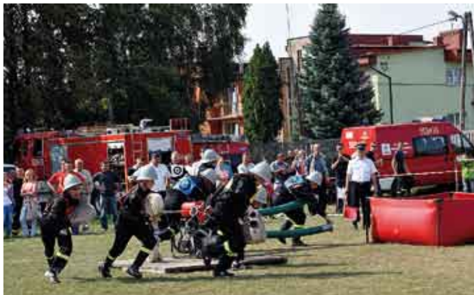
W ćwiczeniu bojowym drużyna OSP seniorów z Sichowa.