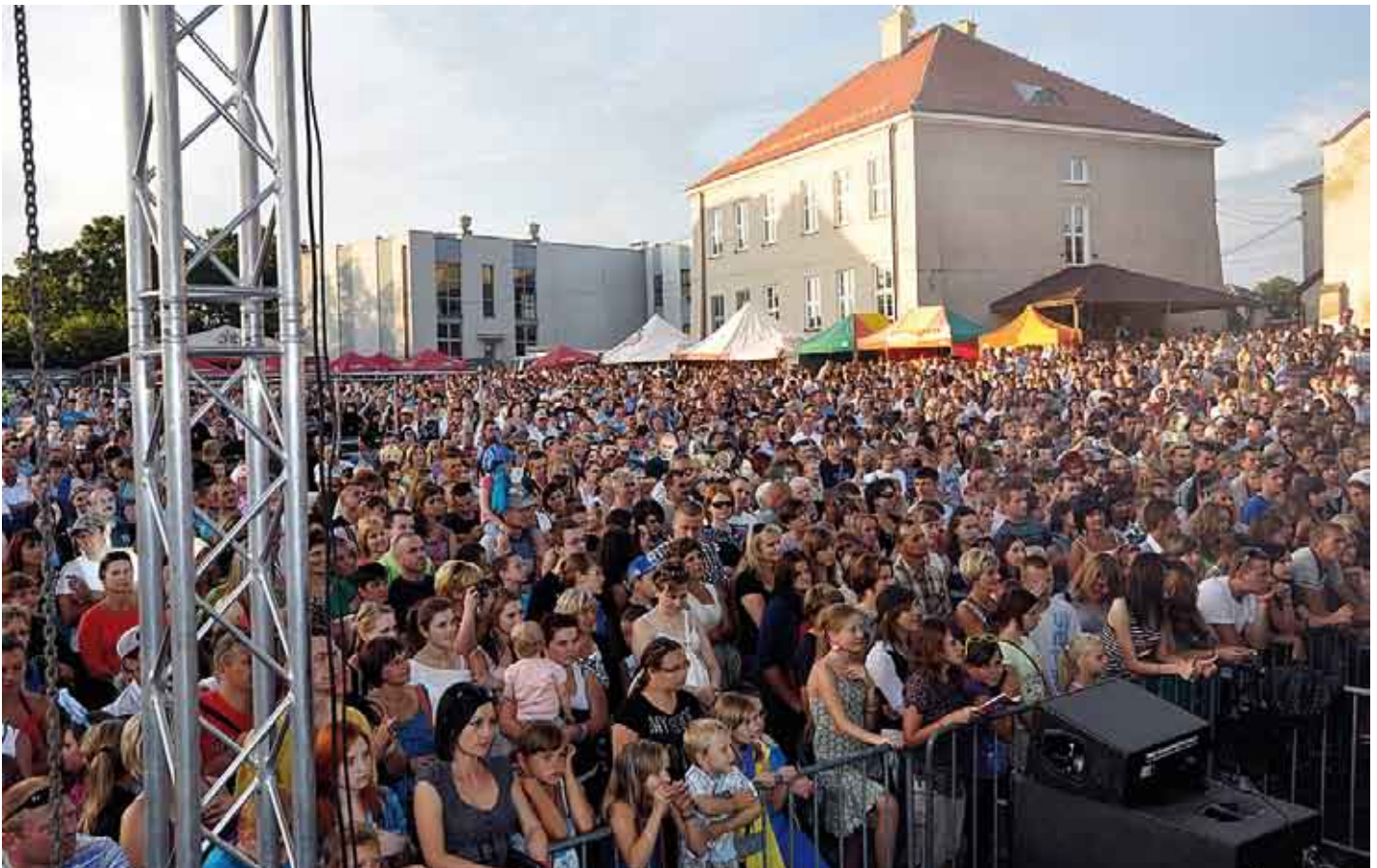
Koncert zespołu „Feel” obejrzało około 5 tys. widzów.