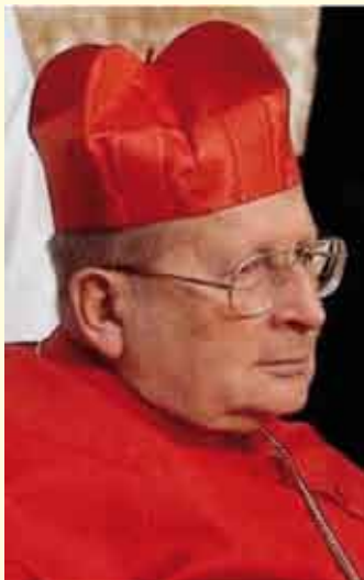
Ks. kardynał Andrzej Maria Deskur, (29.02.1924 – 3.09.2011).