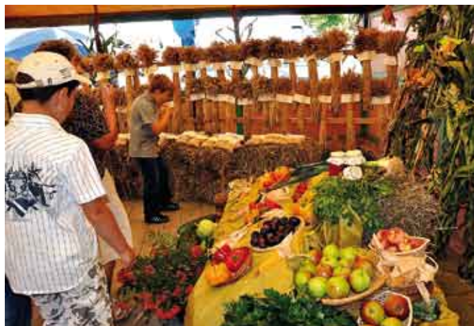
Powiatowy Zespół Doradców w Staszowie SÓDR w Modliszewicach przygotował okazałe stoisko z owocami, zbożami i warzywami.