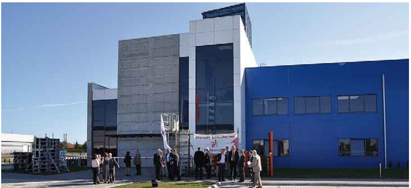
„Inkubator Techniczno-Budowlany” w Rogoźnicy k/Rzeszowa.