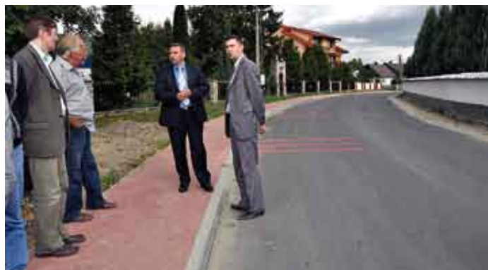
Podczas odbioru odbudowy drogi powiatowej w Potoku, obok kościoła.

Trwają również prace przy przebudowie drogi powiatowej nr 0352T Chańcza – Zapora, droga 0828 T oraz drogi powiatowej nr 0828 T, droga 756 - Korytnica - Kotuszów – Kurozwęki, realizowanej dzięki dotacji z Ministerstwa Transportu w wysokości 252,3 tys. zł, termin zakończenia robót 30.10.2011. Kontynuowana jest również odbudowa dróg powiatowych realizowana