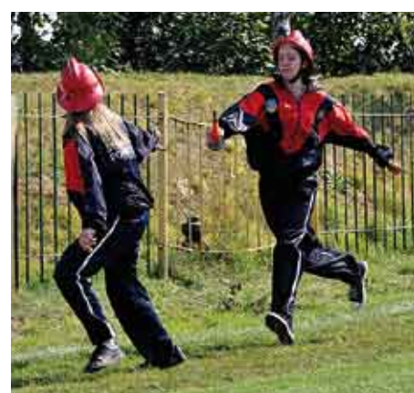
Sztafeta pożarnicza 7x50 m z przeszkodami, zawodniczki MDP z Koniemiotów.