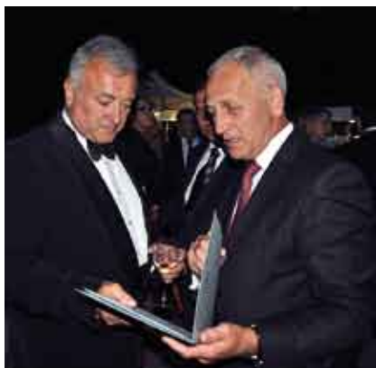
Ambasador nadzwyczajny i pełnomocny Ukrainy w Polsce prof. dr hab. Markijan Malskyj i starosta staszowski Andrzej Kruzel.

W dniu 6 września br., w „Starej Pomarańczarni” na terenie „Łazienek Królewskich” w Warszawie, Ambasada Ukrainy w Polsce zorganizowała uroczyste spotkanie z okazji 20. Rocznicy Niepodległości, na które już po raz piąty z rzędu zostali zaproszeni przedstawiciele władz powiatu staszowskiego.