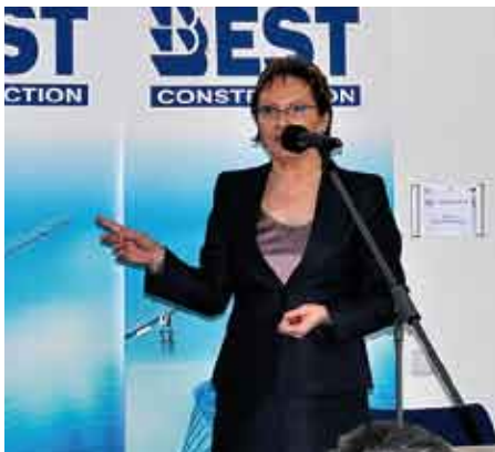
Życzenia i gratulacje składa minister zdrowia Ewa Kopacz.