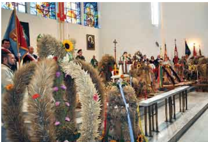
W sanktuarium błogosławionego Jana Pawła II wieńce dożynkowe przed ołtarzem.

Ostatnia niedziela sierpnia br., była dniem uczczenia rolników i rzemieślników branży spożywczej, podziękowania za ich trud i wspaniałe efekty pracy, które podziwiać i spożywać można było w czasie pikniku w kompleksie rekreacyjno-sportowym „Zalew nad Czarną” w Staszowie.