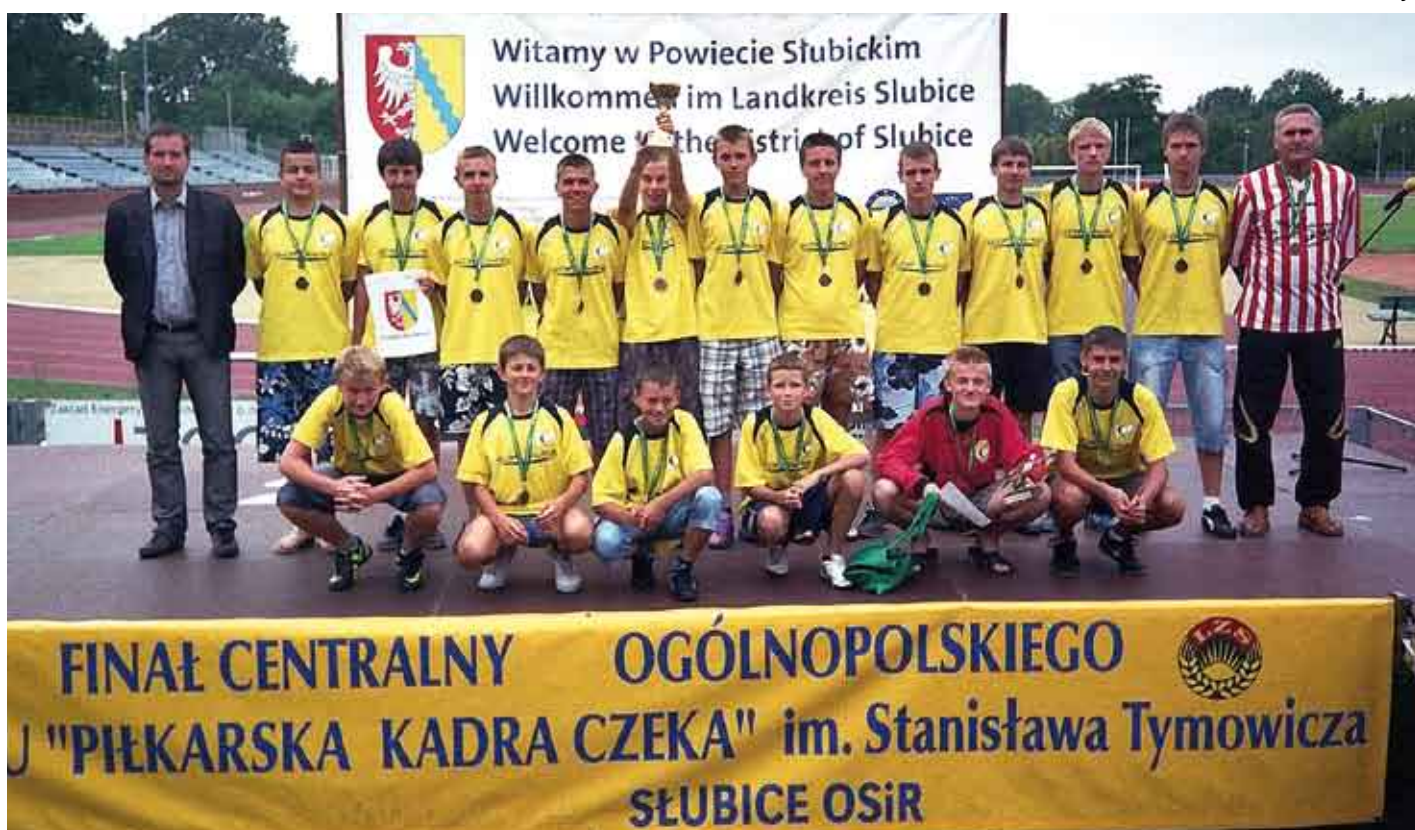
Drużyna MKS „Czarni” Połaniec na turnieju w Słubicach.