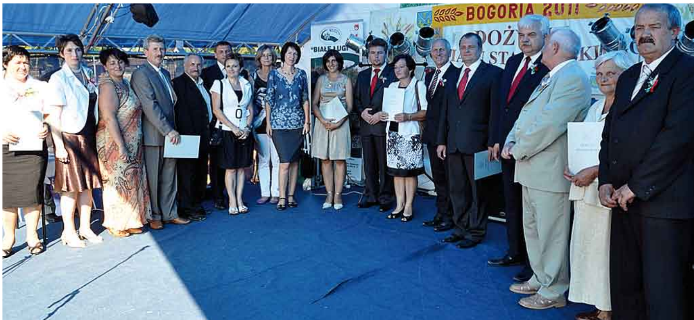
Wspólne zdjęcie: zespołów wieńcowych, starostów staszowskich, burmistrzów i wójtów.