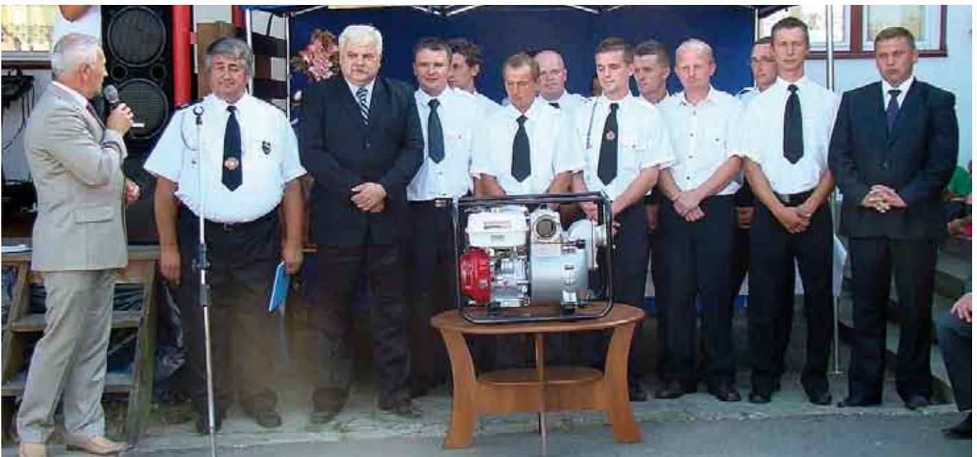
Niedziela, 21 sierpnia br. była również dniem dożynek wiejskich w Pliskowoli, pompę marki „Honda” dla miejscowej jednostki OSP zakupiono ze środków powiatu staszowskiego.