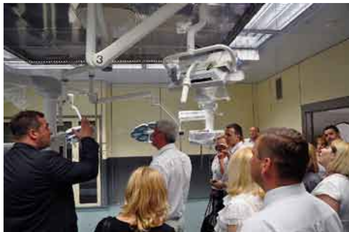
Na jednej z sal operacyjnych nowego bloku.