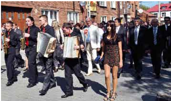
Powiat staszowski, w pochodzie do kolegiaty skalbmierskiej.

Widowisko „Świątokrzyskie granie, tańce i śpiewanie”, konkurs wieńców dożynkowych, występy zespołów folklorystycznych i rewia kawalerii, towarzyszyły XI Świątokrzyskim Dożyńkom Wojewódzkim, jakie w niedzielę 11 września br., odbyły się w Skalbmierzu w powiecie kazimierskim. Organizatorami imprezy byli: marszałek województwa świętokrzyskiego, prezes Świątokrzyskiej Izby Rolniczej, starosta kazimierski i burmistrz Skalbmierza.