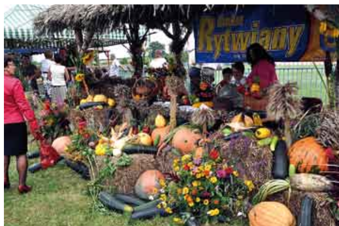
Stoiska stowarzyszeń i firm prezentowały się bardzo okazale.