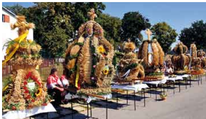
Tegoroczne, najpiękniejsze wieńce dożynkowe z gmin powiatu staszowskiego.