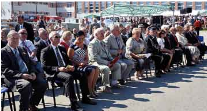
Samorządowcy i goście honorowi, podczas oficjalnej części dożynek.