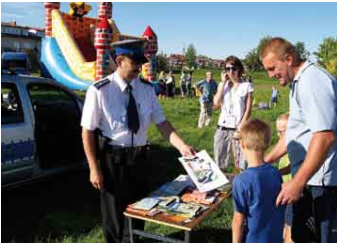
Integracja z najmłodszymi podczas festiwalu.