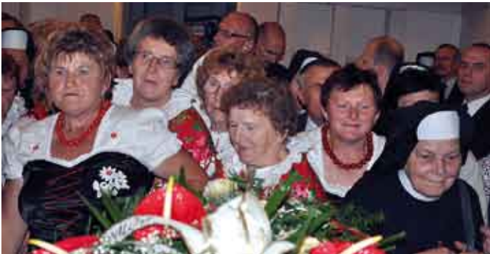
Mieszkańcy gminy Działoszyce i sołectwa Sancygniów żegnają swojego kardynała.