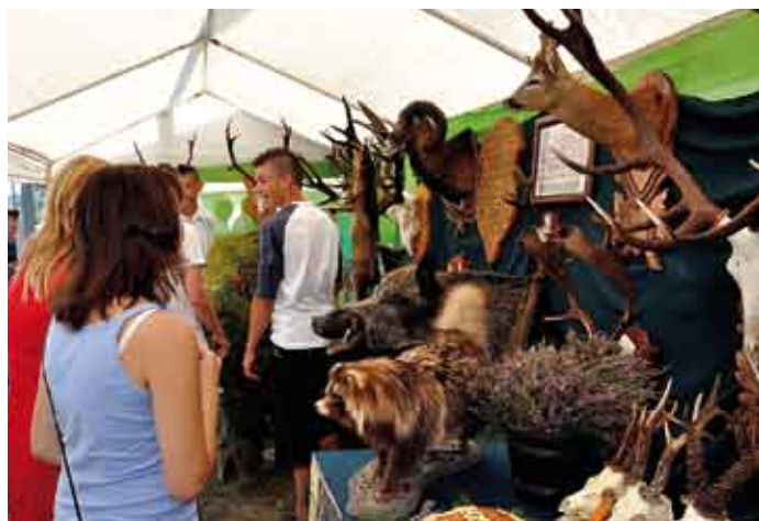
Fachowo przygotowana, interesująca ekspozycja Koła Łowieckiego „Głuszc”.