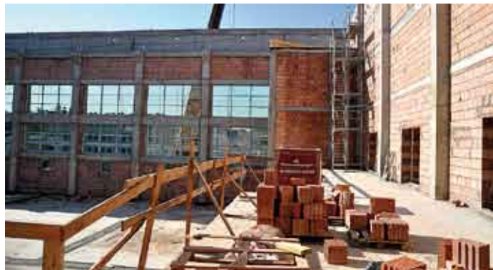
Powiatowe Centrum Sportowe w Staszowie, stan prac w dniu 24 września 2011 r.