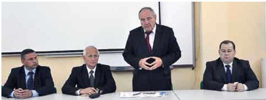
Przed rozpoczęciem szkolenia wicemarszałek województwa świętokrzyskiego Kazimierz Kotowski podsumował dotychczasowe rezultaty wspierania przedsiębiorców województwa środkami z funduszy unijnych.

W dniu 19 września br., w sali konferencyjnej Centrum Kształcenia Praktycznego w Staszowie odbyło się szkolenie z zakresu pozyskiwania środków finansowych z funduszy Unii Europejskiej w ramach działania 1.1 pn. „Bezpośrednie wsparcie sektora mikro, małych i średnich przedsiębiorstw”.