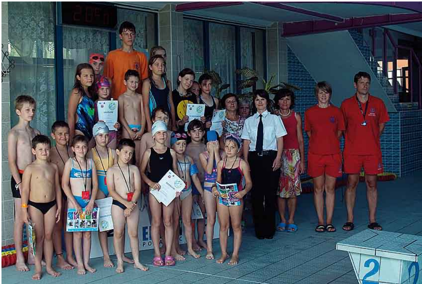
Uczestnicy zawodów po ukończeniu rywalizacji i odebraniu wyróżnień.

W dniu 30 sierpnia br., na pływalni w Połańcu nastąpiło oficjalne podsumowanie akcji letniej „Już pływam 2011”. Z tej okazji staszowscy policjanci zorganizowali zawody pływackie, podczas których jej uczestnicy mogli wykazać się postęпами w nauce pływania.