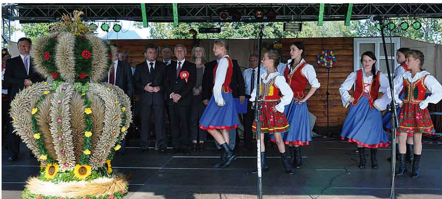
Podczas prezentacji wienców na scenie powiat staszowski.