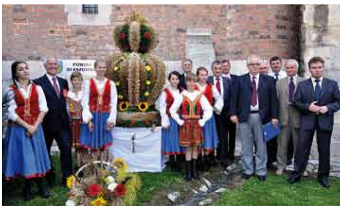
W konkursie wojewódzkim powiat staszowski reprezentował wieniec wykonany przez sołectwa: Tursko i Tursko Małe Kolonia.