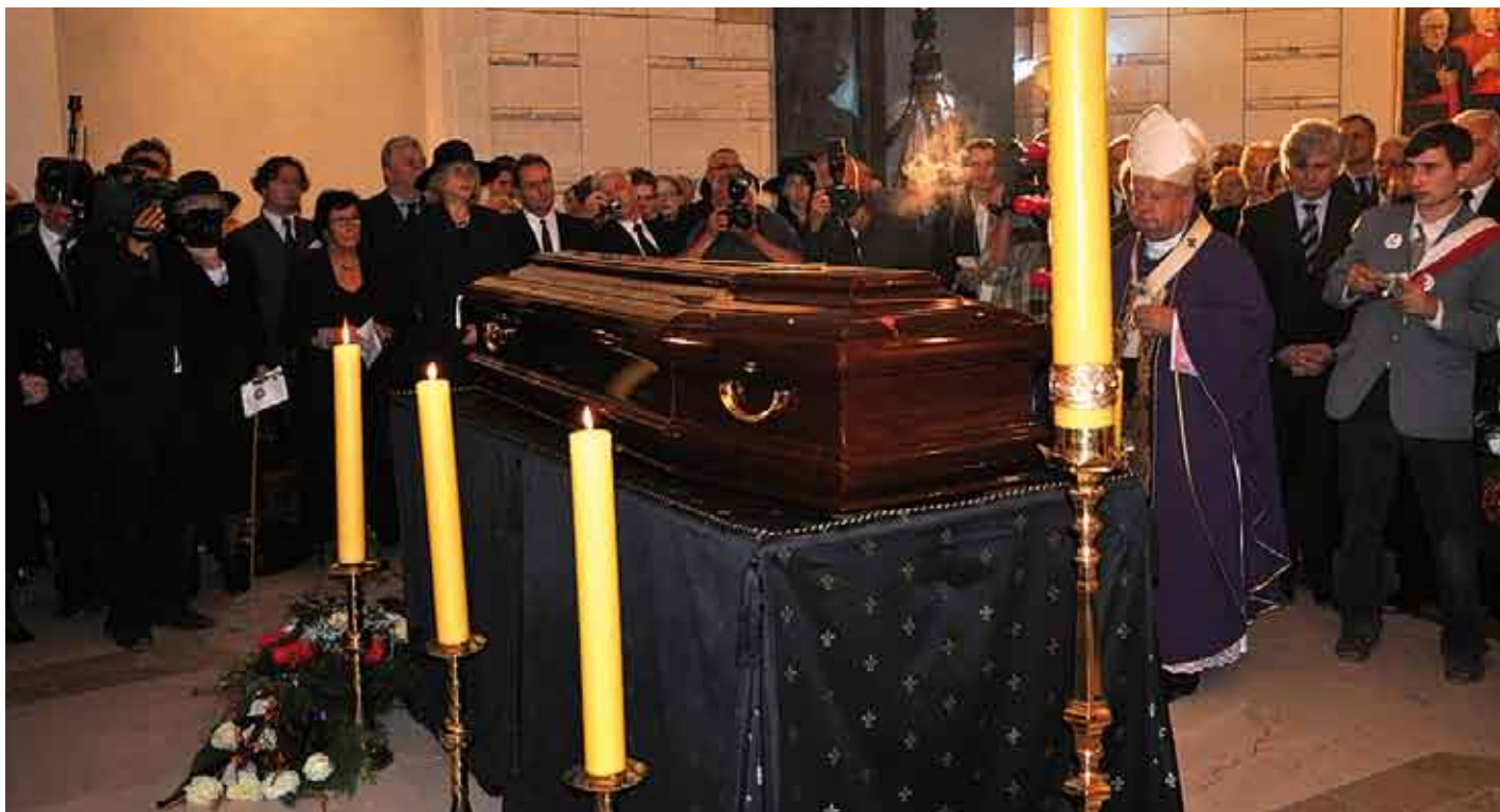
W dniu 12 września br., podczas mszy świętej pogrzebowej w krypcie sanktuarium bł. Jana Pawła II w Krakowie – Łagiewnikach.