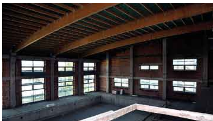
Wykonana konstrukcja dachu z drewna klejonego nad halą basenową, 24 września 2011 r.