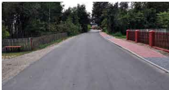
Na drodze powiatowej w Wymysłowie.