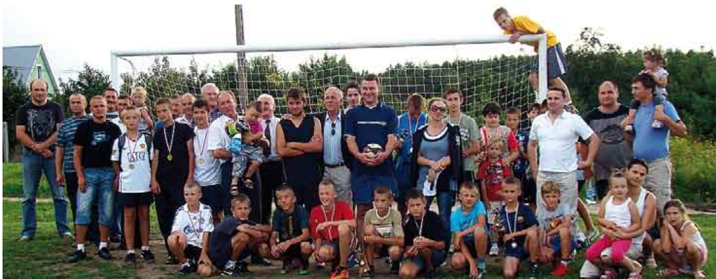
Prawdziwe sportowe pikniki rodzinne.