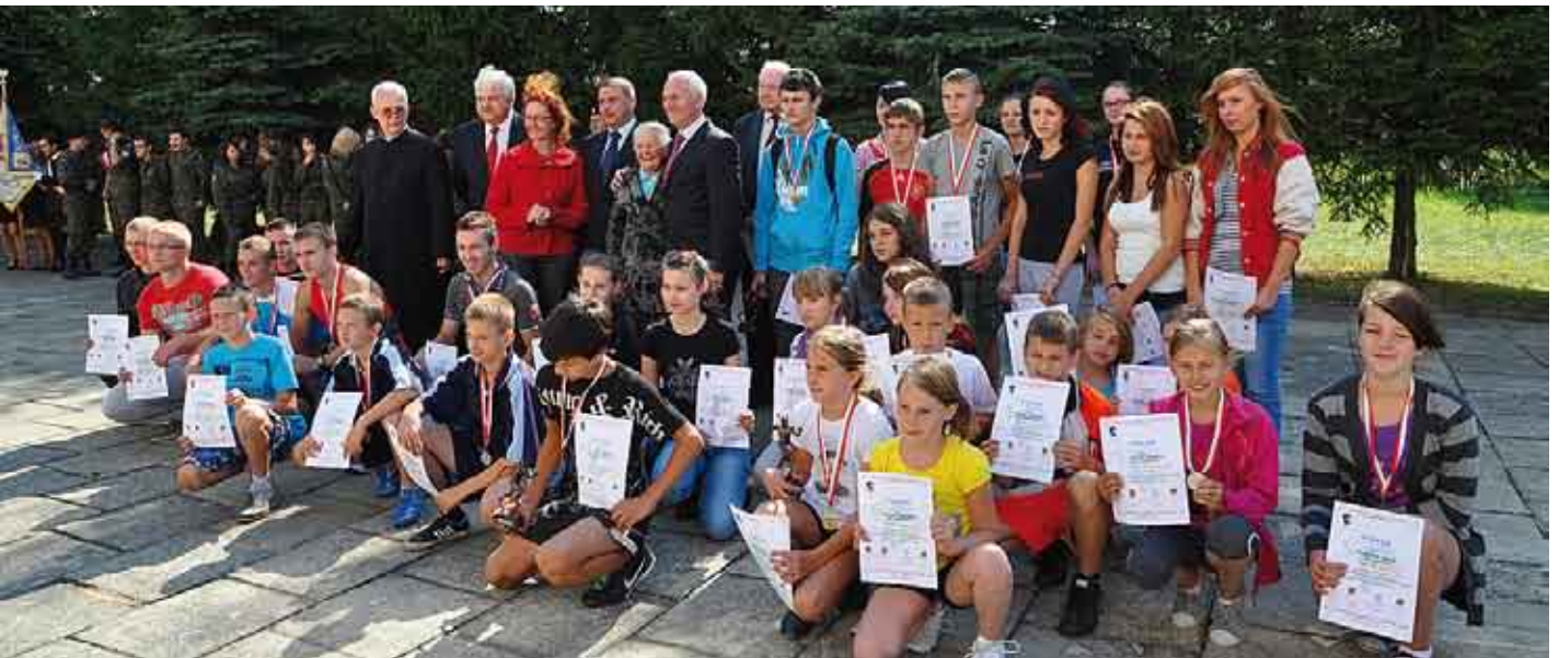
Pamiętkowe zdjęcie biegaczy i wręczających medale.