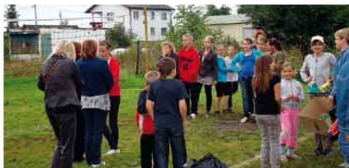
W imprezach uczestniczyli uczniowie szkół podstawowych i gimnazjów.