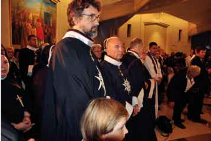
Członkowie „Zakonu Kawalerów Maltańskich”.