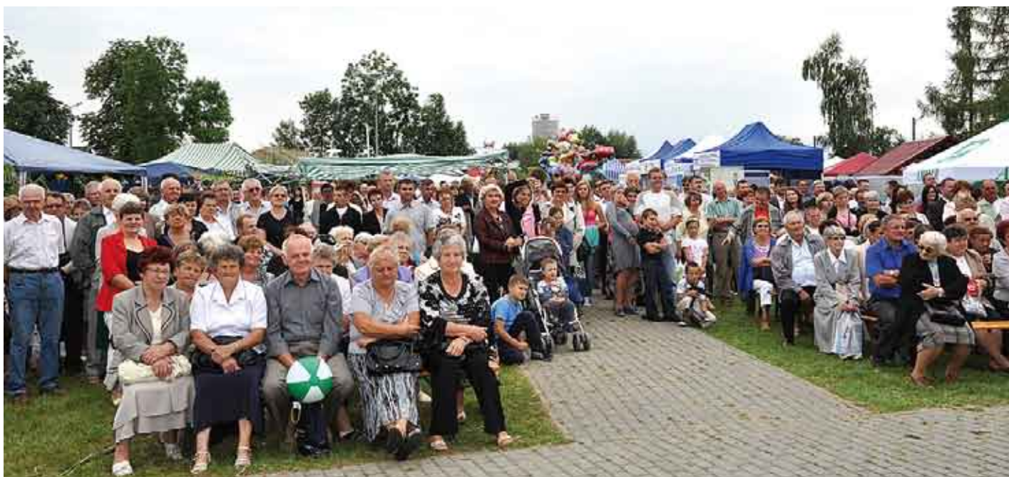
Licznie zebrana publiczność, mimo niepewnej pogody.