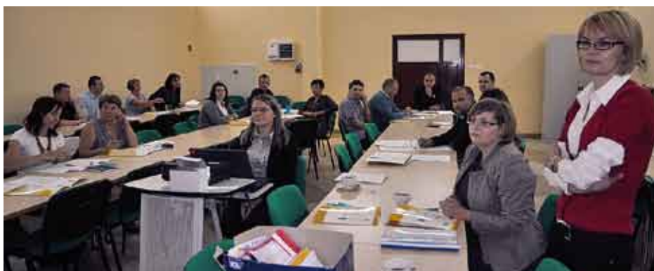
W szkoleniu udział wzięło około 30 przedsiębiorców z powiatu staszowskiego i powiatów sąsiednich.