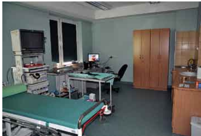
Pracownia endoskopowa w nowych pomieszczeniach bloku operacyjnego.

Jeszcze w tym roku planowane jest wykonanie instalacji przeciwoblodzeniowej rynien i rur spustowych na budynku Liceum Ogólnokształcącego im. ks. kard. Stefana Wyszyńskiego w Staszowie mającej na celu wyeliminowanie niekorzystnych dla ludzi i budynku zjawisk - znaczne opady śniegu i deszczu przy ujemnej temperaturze zewnętrznej zamarzając tworząc sople zagrażające przechodniom i uszkadzające elewację budynku. Całkowita szacunkowa wartość zadania to ponad 52 tys. złotych . Po wyłonieniu wykonawcy, w październiku br. planowane jest rozpoczęcie realizacji tej inwestycji.