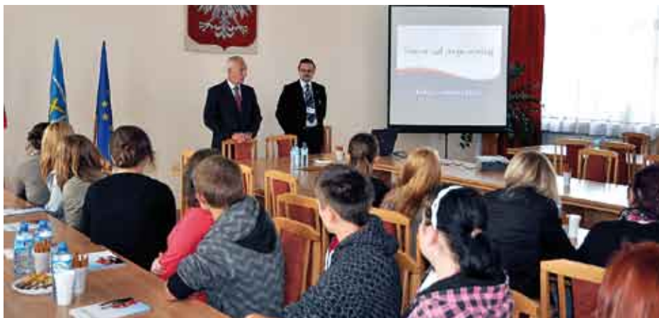
Uczniów szkół powiatu staszowskiego powitał starosta staszowski Andrzej Kruzel, który jednocześnie wyczerpująco scharakteryzował pracę jednostki.