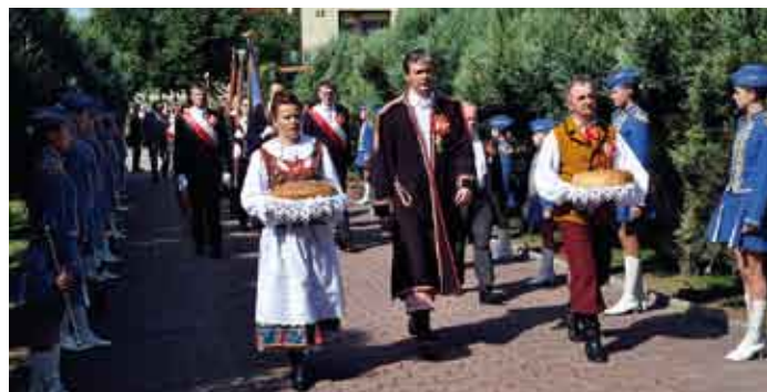
Dożynkowy pochód zbliża się do kolegiaty.