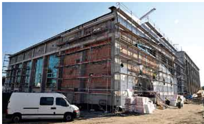
Powiatowe Centrum Sportowe w Staszowie, stan prac w dniu 24 września 2011 r.