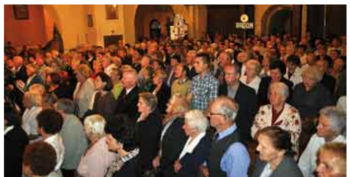
Wierni w koniemłockiej świątyni.