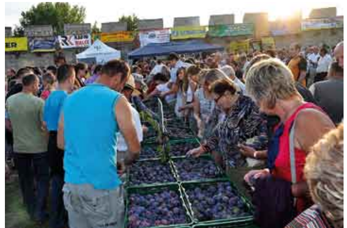
W niedzielę po godz. 18 00 , wystawa śliwek została przeznaczona do konsumpcji.