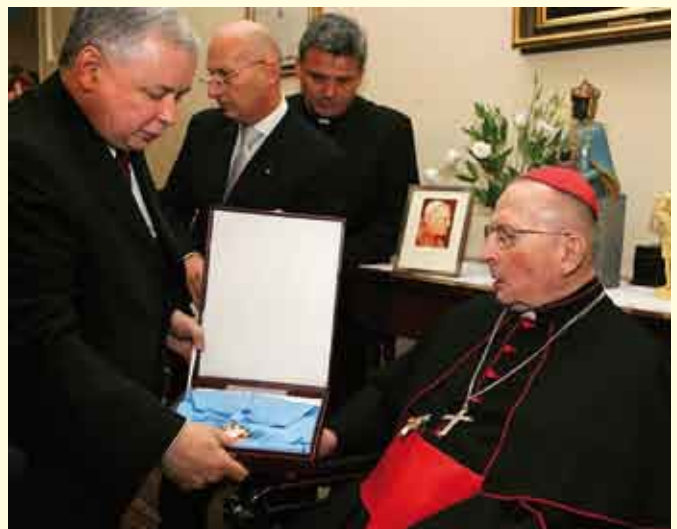
W dniu 12 października 2006 roku, ówczesny premier RP Jarosław Kaczyński odznaczył ks. kardynała Andrzeja Marię Deskura „Orderem Orła Białego”, więcej czyt. „Powiat Staszowski” nr. 25/grudzień 2006, na www.staszowski.eu w „Wydania archiwalne”.

Życiorys ks. kard. Deskura podano za Katolicką Agencją Informacyjną.