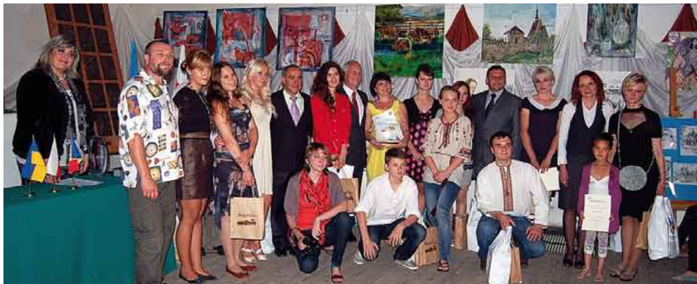
Pamiątkowe zdjęcie artystów i organizatorów pleneru.