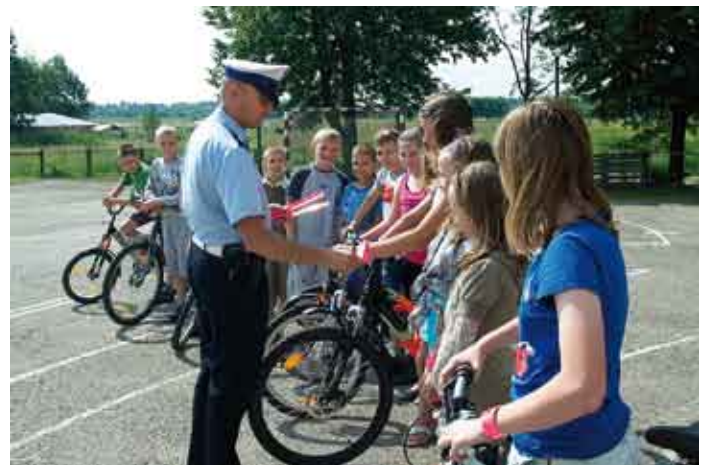
„Odblaski” zapewniające większą widoczność i bezpieczeństwo na drodze.

Tekst: st. asp. Aneta Nowak-Lis