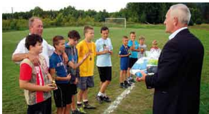
Nagrodami były piłki, rakietki tenisowe i inny drobny sprzęt sportowy.