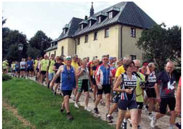
Klasztor ojców Sercanów w Stopnicy.