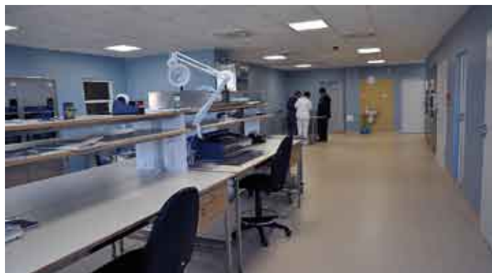
Sterylizatornia w nowym bloku pracuje na rzecz całego szpitala.