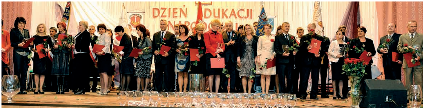
Dyrektorzy i pedagodzy wyróżnieni Nagrodą Burmistrza Miasta i Gminy Staszów.