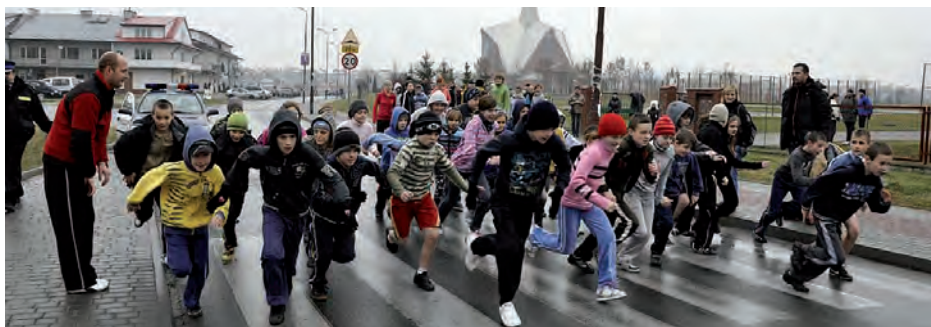
Wystartowali najmłodszy – uczniowie Szkół Podstawowych.