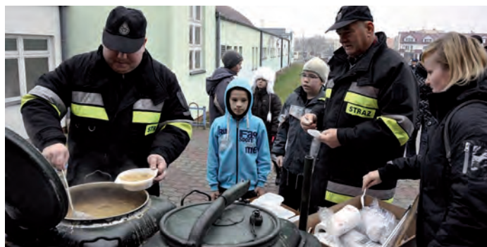
Staszowscy druhowie OSP częstowali grochówką.