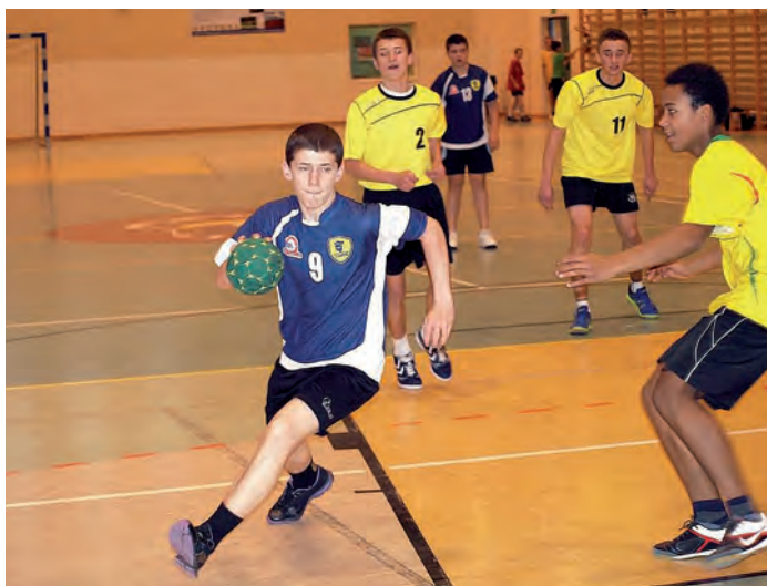
„Święta wojna” - przeciwko sobie stanęły drużyny Gimnazjum Czajków I oraz Gimnazjum Czajków II.