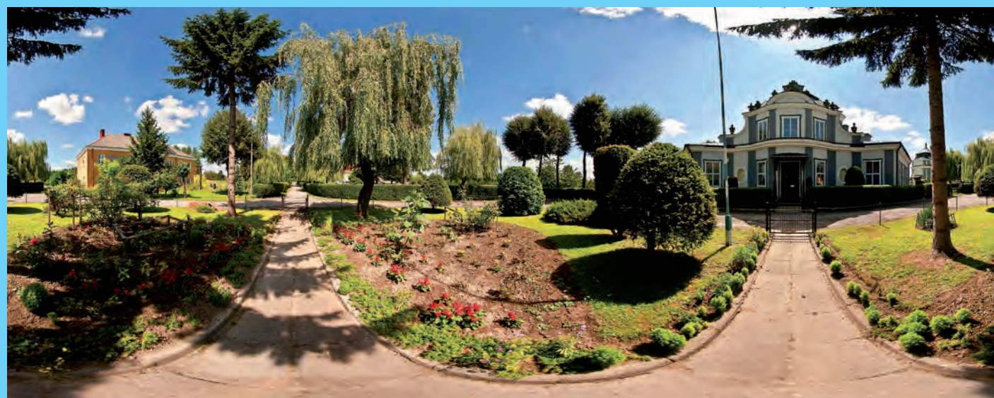
Pałacyk w Grabkach Dużych z poł XVIII w.