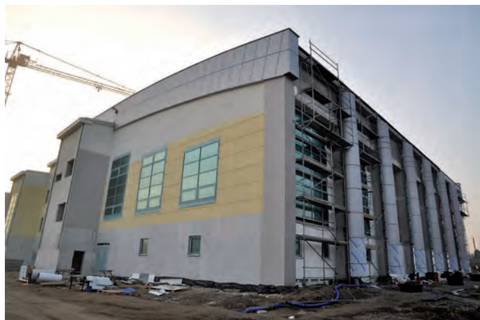
Powiatowe Centrum Sportowe w Staszowie, widok od strony południowo-zachodniej, stan prac na 30 listopada 2011 roku.