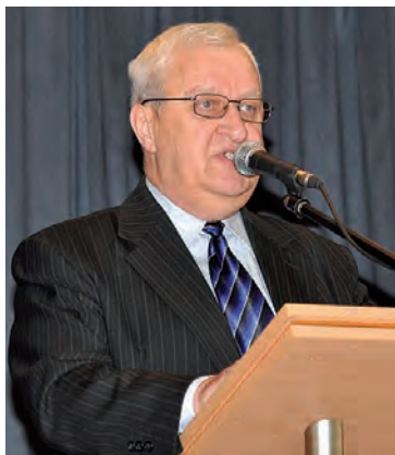
Rektor Wyższej Szkoły Umiejętności w Kielcach wita wszystkich przybyłych na seminarium.