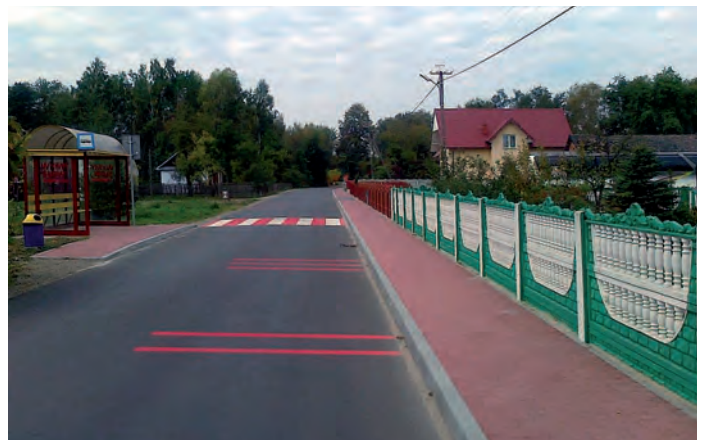
Droga pow. nr 0841T Rudniki – Zrębin, w miejscowości Wymysłów.