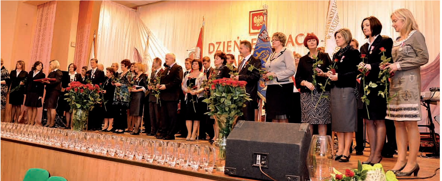
Pedagodzy odznaczeni Srebrnymi i Brązowymi Medalami „Za długoletnią służbę”.