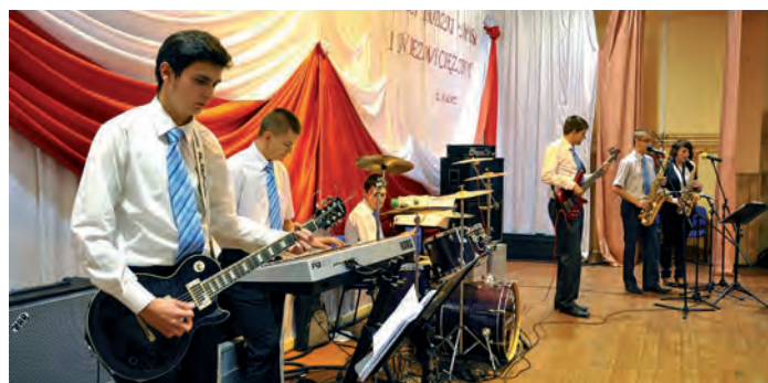
Gra i śpiewa „Staszicówka Band”.

Po zakończeniu części oficjalnej, uczestnicy spotkania wysłuchali koncertu zespołu „Staszicówka Band”, który tworzą uczniowie Zespołu Szkół w Staszowie. Całe spotkanie zakończył poczęstunek przygotowany przez kuchnię miejscowego internatu.