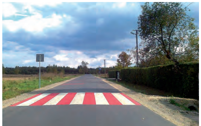
Droga powiatowa nr 0022T Chmielnik – Życiny, koło DPS w Rudkach.