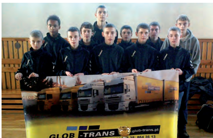
Młodzicy KS KORAB OSiR Staszów (klasa sportowa ZS Czajków).