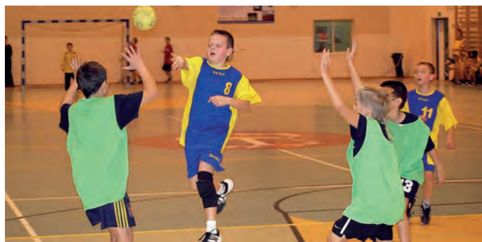
Zmagania najmłodszych - SP Bogoria II (niebiesko-żółte stroje) vs. SP Nr 3 w Staszowie.