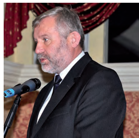
Życzenia pracownikom „Siarkopolu” składa poseł Lucjan Pietrzyk.