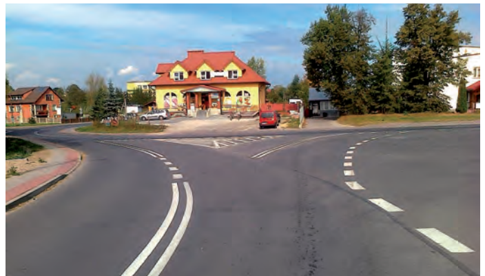
Droga pow. nr 0833T Sielec - Koniemłoty – Niziny, (skrzyżowanie w Koniemłotach).