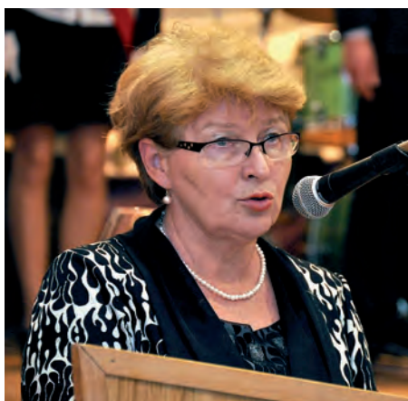
Życzenia i gratulacje pedagogom składa wojewoda świętokrzyski Bożentyna Pałka-Koruba.