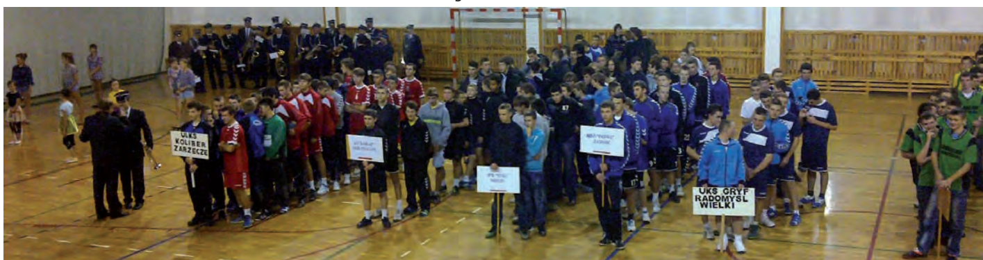
Ceremonia otwarcia XVII Turnieju Mikołajkowego Piłki Ręcznej w Zarzeczcu, powiat przeworski, województwo podkarpackie.