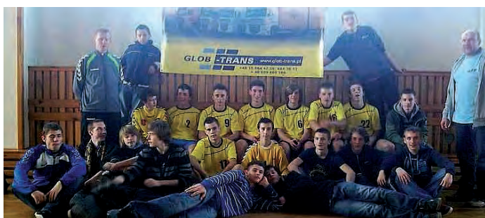
Juniorzy młodsi oraz młodzicy KS KORAB OSiR Staszów.