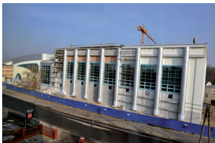
Powiatowe Centrum Sportowe od strony południowej.