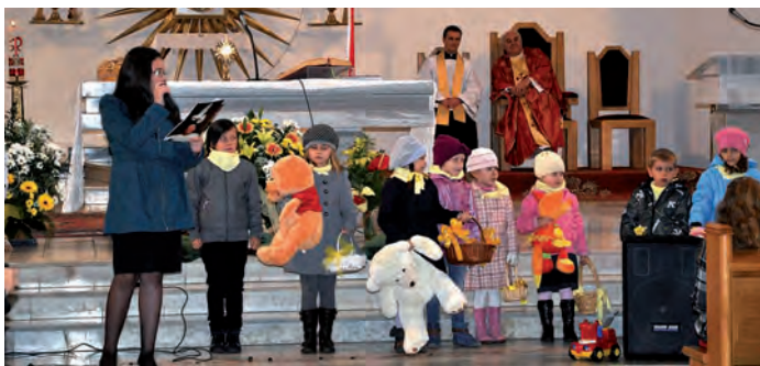
Na zakończenie wierni wysłuchali montażu słowno – muzycznego w wykonaniu dzieci i młodzieży ze staszowskich szkół.