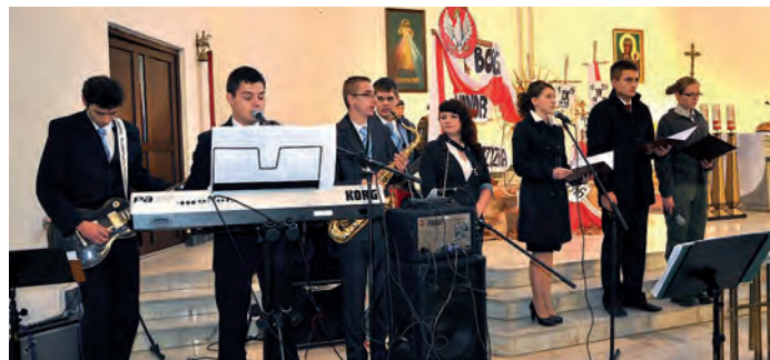
Uczniowie Zespołu Szkół w Staszowie w montażu słowno muzycznym, poświęconym walce o niepodległość ojczyzny.