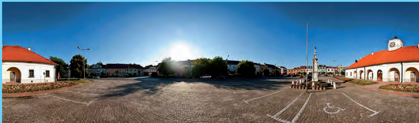
Panoramyczny fragment staszowskiego Rynku.