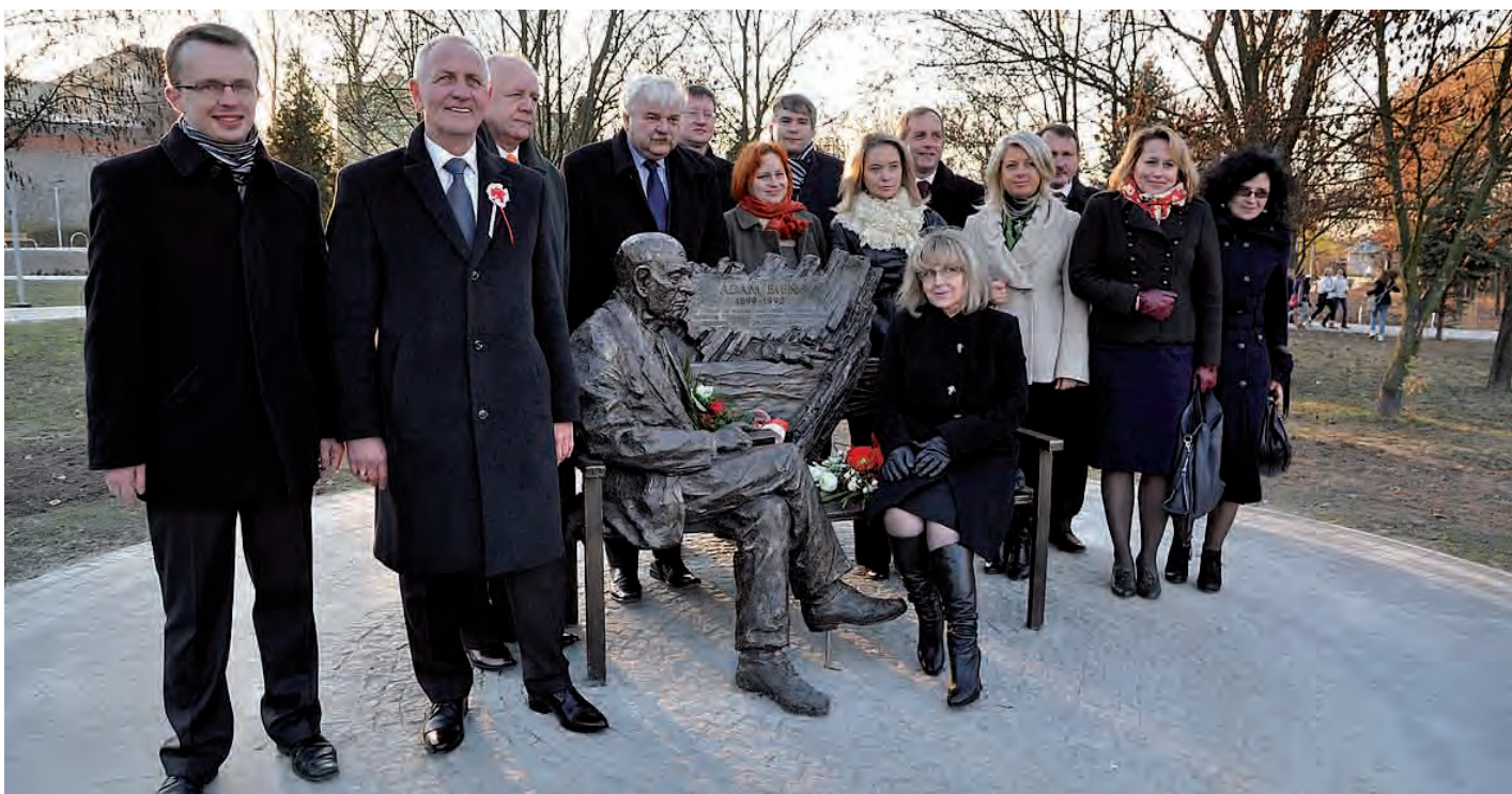
Pamiątkowe zdjęcie z patronem parku.