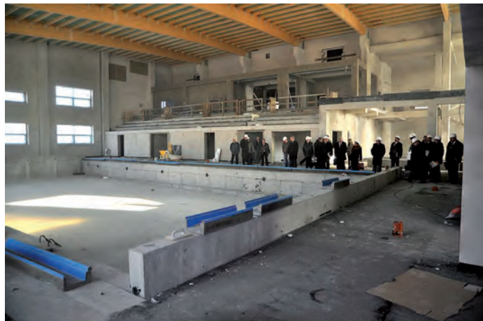
Na głównej pływalni.