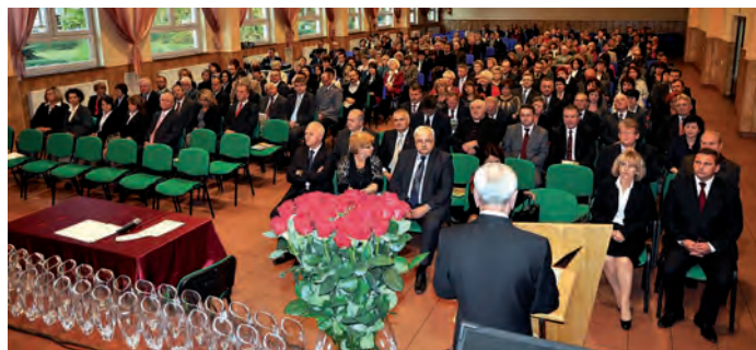
Sesja odbyła się w auli Zespołu Szkół w Staszowie.