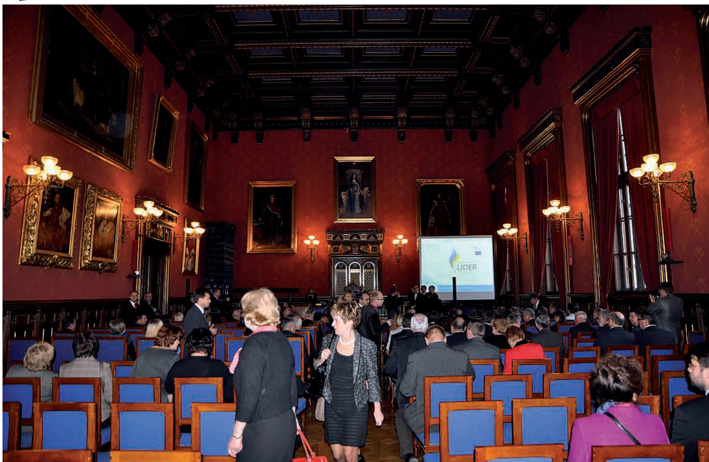
Uroczyste wręczenie statuetek i certyfikatów „Samorządowy Lider Edukacji”, odbyło się w zabytkowych wnętrzach auli Collegium Novum Uniwersytetu Jagiellońskiego w Krakowie.