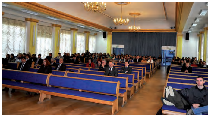
Seminarium, cieszące się dużym zainteresowaniem studentów i kielczan, odbyło się w auli WŚU im. Stanisława Staszica w Kielcach.