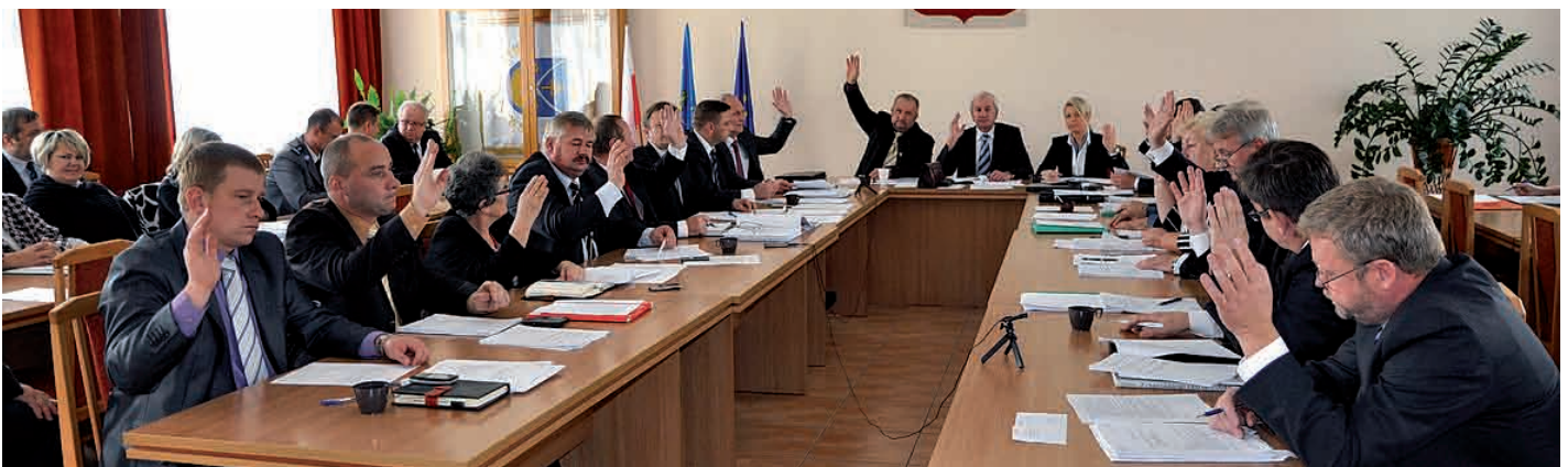
Radni powiatu staszowskiego przegłosowują kolejny projekt uchwały.