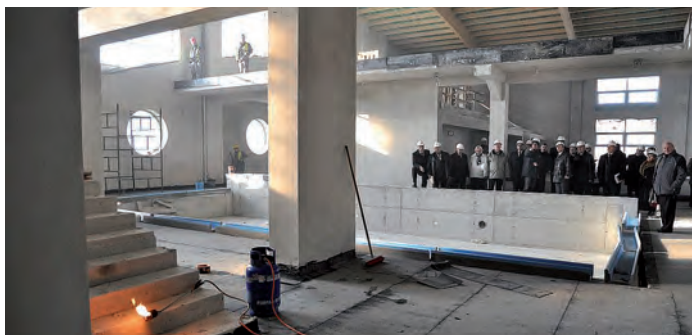
Przed mniejszym basenem.