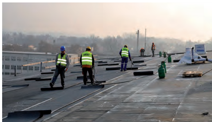
Prace wykończeniowe na dachu.