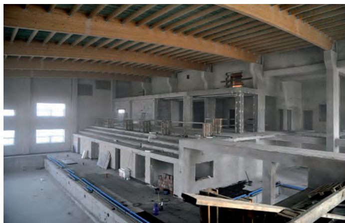
Pływalnia, basen większy.