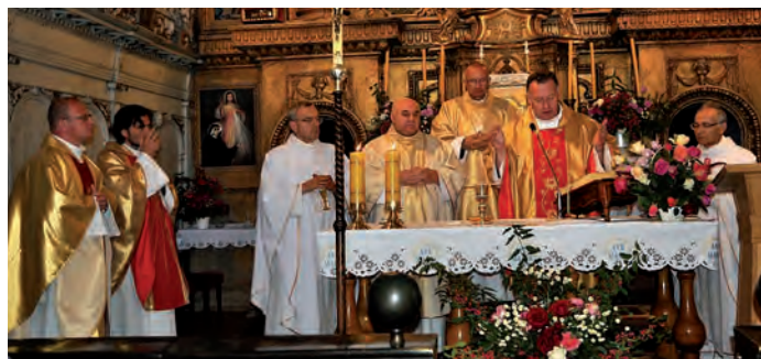
O godz. 12 00 w kościele pokamedulskim w Rytwianach została odprawiona msza święta dziękczynna za dotychczasowe dzieło odbudowy klasztoru.

nego Ośrodka Kultury i Edukacji „Źródło”. Radosny to jubileusz, który zamyka pierwszy etap i otwiera następny – bo Bóg, jak widać, Dziełu błogosławi. ...Gratuluję Drogiemu