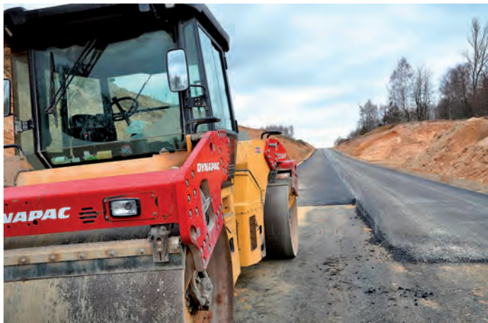
Obwodnica Kurozwek, z Niemścic w kierunku na Szydłów.