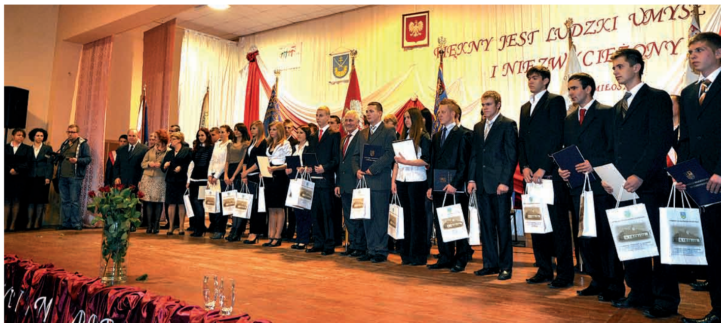
Stypendyści ze szkół ponadgimnazjalnych powiatu staszowskiego z wręczającymi zaświadczenia.