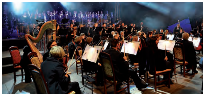
Orkiestra i chór.