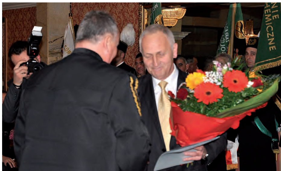
Kwiaty i okolicznościowy adres od władz powiatu staszowskiego.