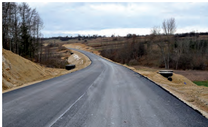
Obwodnica Kurozwek, z Niemścic w kierunku na Szydłów.