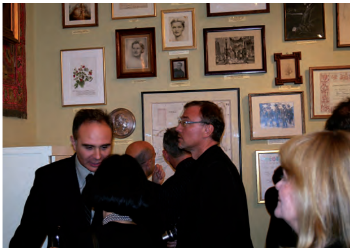
Na ścianach liczne fotografie rodzinne.