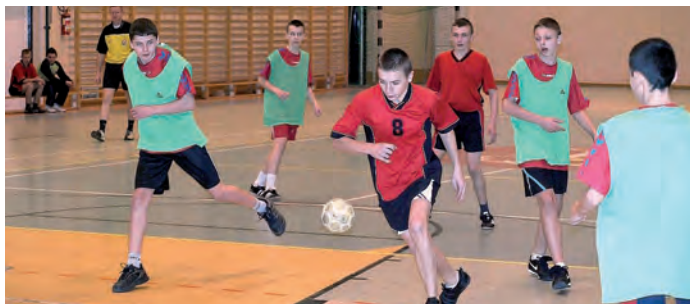
SP Bogoria I vs. SP Sichów Duży (zielone narzutki).