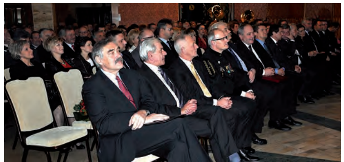
Wśród zaproszonych gości: posłowie na Sejm, przedstawiciele kancelarii Prezydenta RP i ministra gospodarki, samorządowcy wszystkich szczebli i przedsiębiorcy.