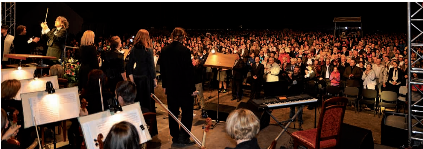
Owacje na stojąco należne artystom po takim koncercie.