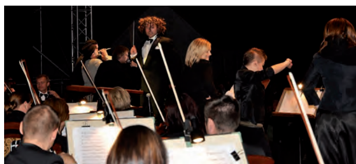
Podczas śpiewania utworów „na bis”.