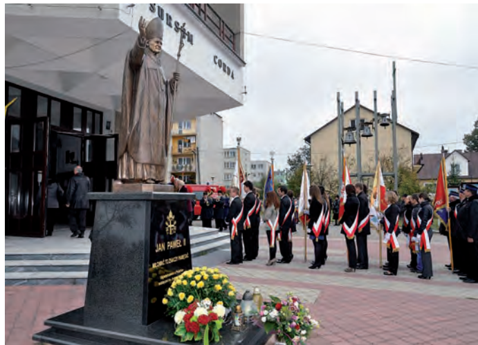
Pocztę sztandarową przed rozpoczęciem nabożeństwa.