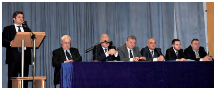
Przemawia poseł do Parlamentu Europejskiego Jacek Włosowicz.