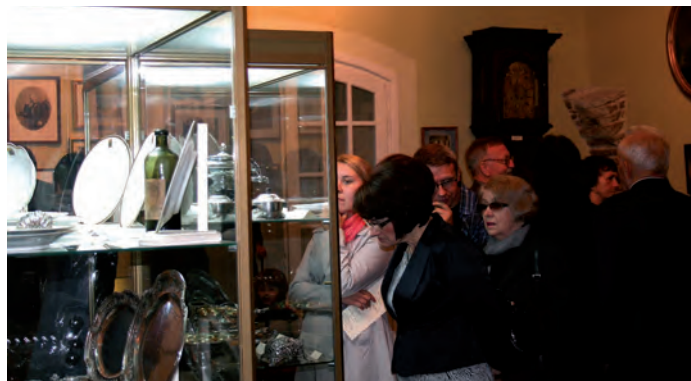
Część zastawy stołowej uratowanej z zawieruchy wojennej.