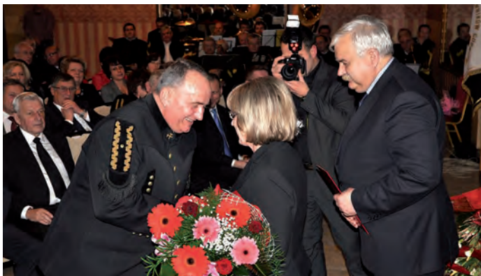
Kwiaty i życzenia od władz miasta i gminy Staszów.