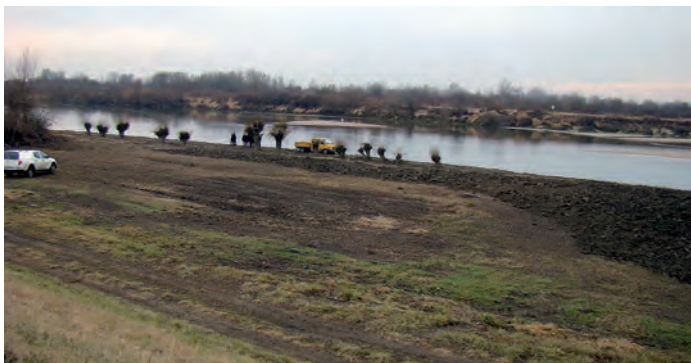
Wisła, widok z wałów w miejscowości Słupiec, gmina Łubnice.