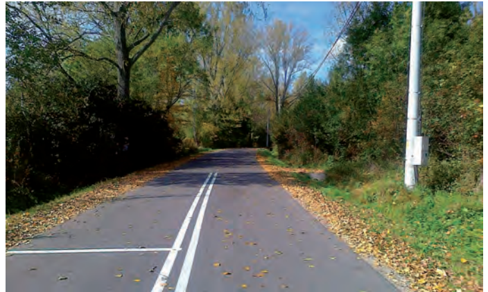
Droga pow. nr 0832T Sielec - Zięblice - Krzywołęcz - Grzybów.

Ponadto, wstępnie został zakwalifikowany do realizacji wniosek na zadanie pn. „Przebudowa dróg powia-