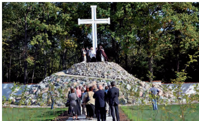
„Rytwiańska Golgota” na terenie pokamedulskiego ogrodu.