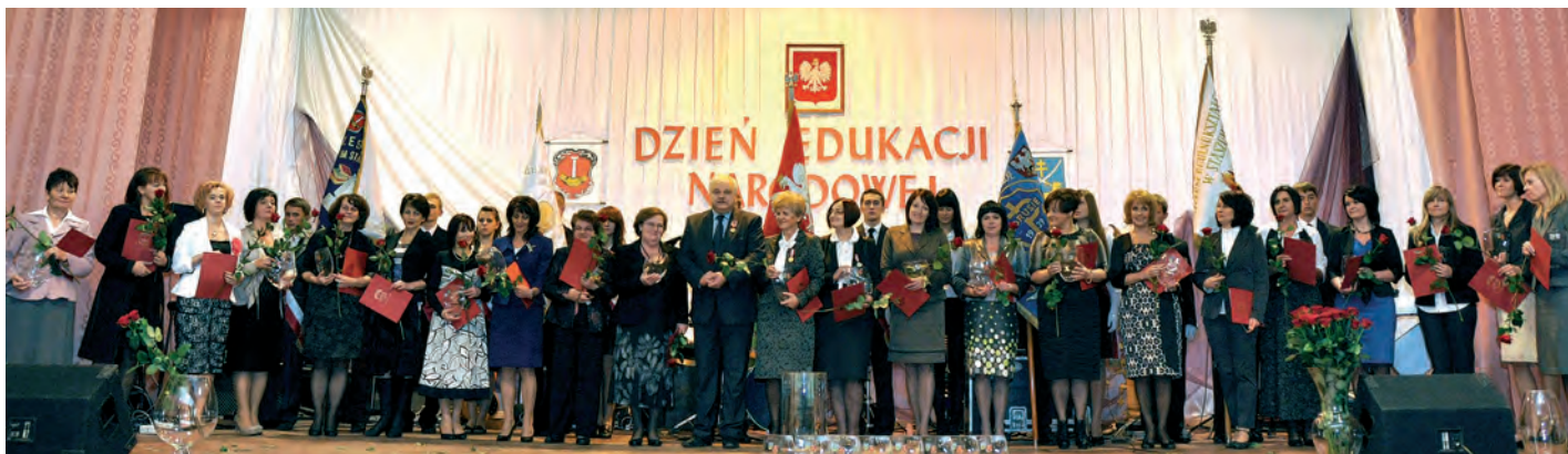
Dyrektorzy i pedagodzy wyróżnieni Nagrodą Burmistrza Miasta i Gminy Staszów.