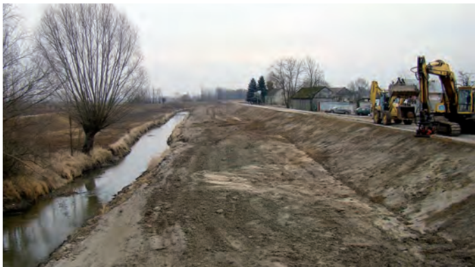
Odbudowany wał Kanału Strumień w Orzelcu, po powodzi w 2010 roku.