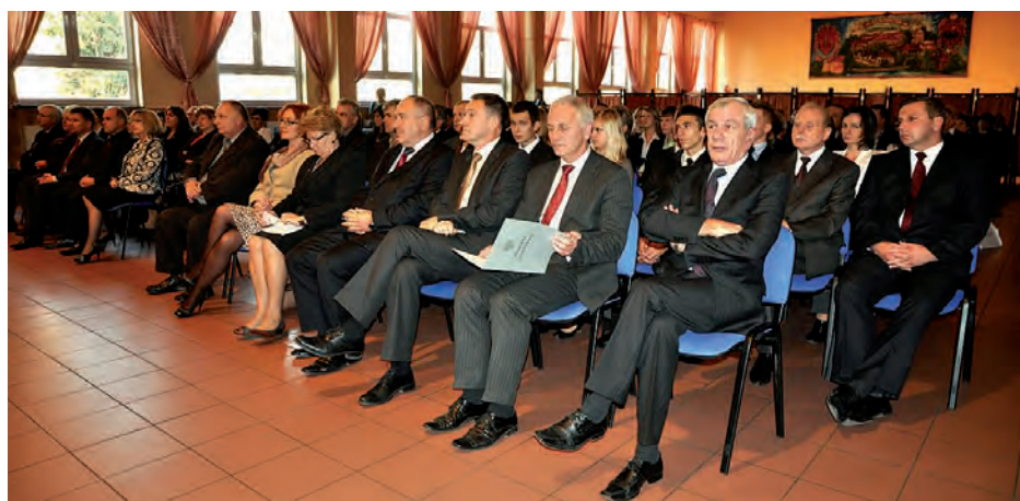
W pierwszym rzędzie przedstawiciele władz wojewódzkich, powiatowych i gminnych.