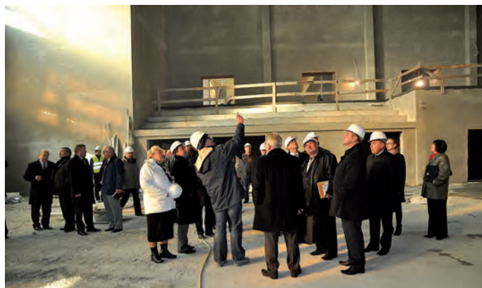
Hala sportowa w budowie.