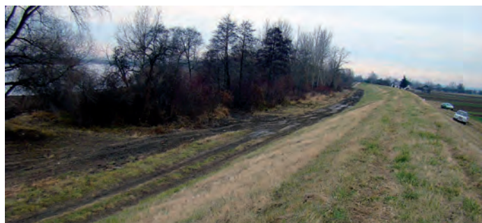
Wał wiślany w Słupcu.