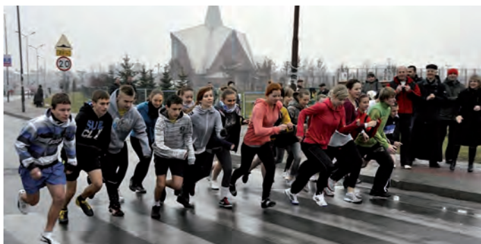
Na starcie uczniowie szkół gimnazjalnych.