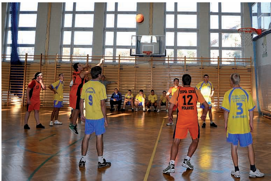
Podczas meczu pomiędzy ZSE w Staszowie i ZS w Połańcu.