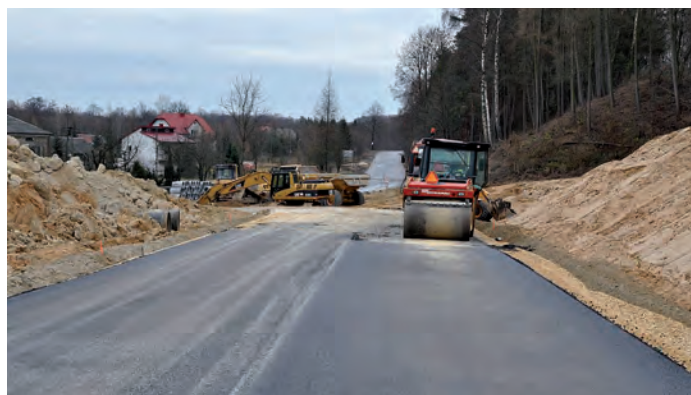
Obwodnica Kurozwek, w kierunku od drogi na Ponik do Niemścic, przy drodze wojewódzkiej Kurozweki-Staszów.