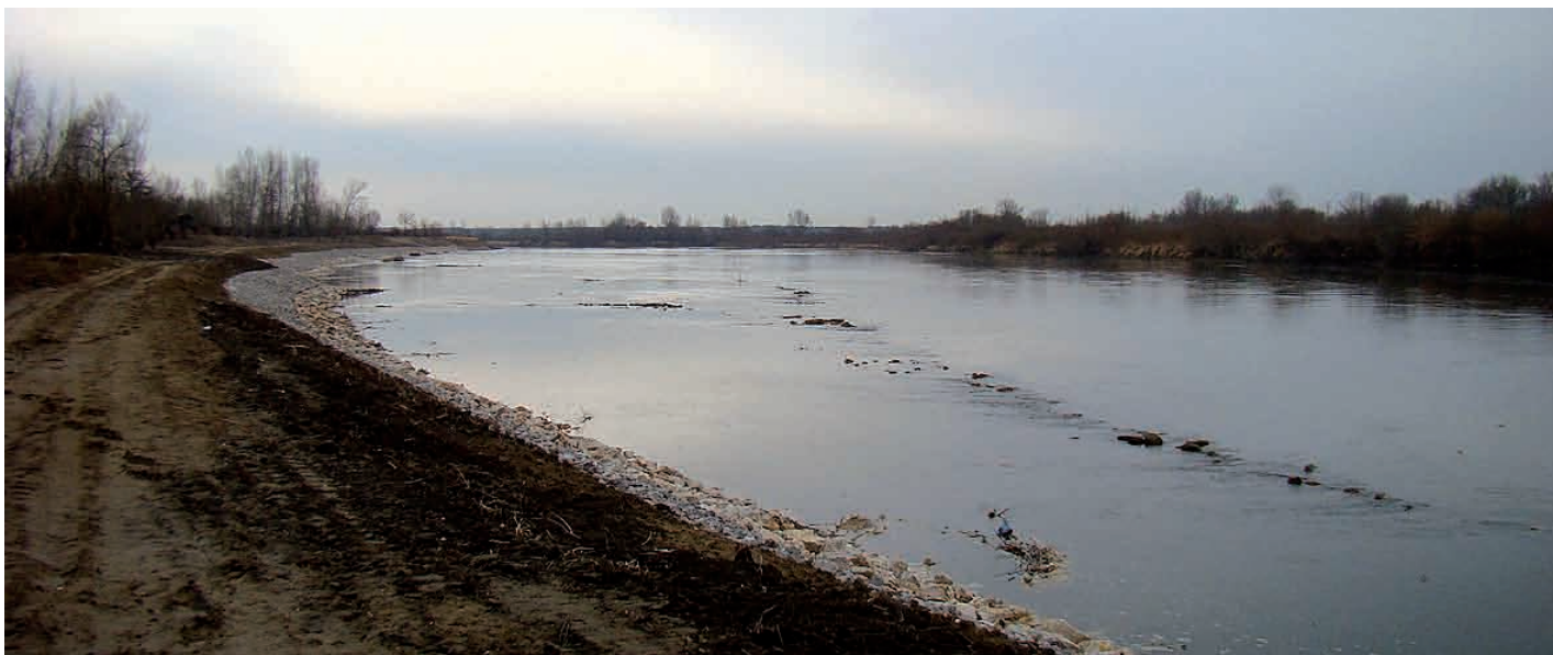
Wzmocnione nabrzeże Wisły w Słupcu. W wodzie widoczne przedwojenne zabezpieczenie brzegu.