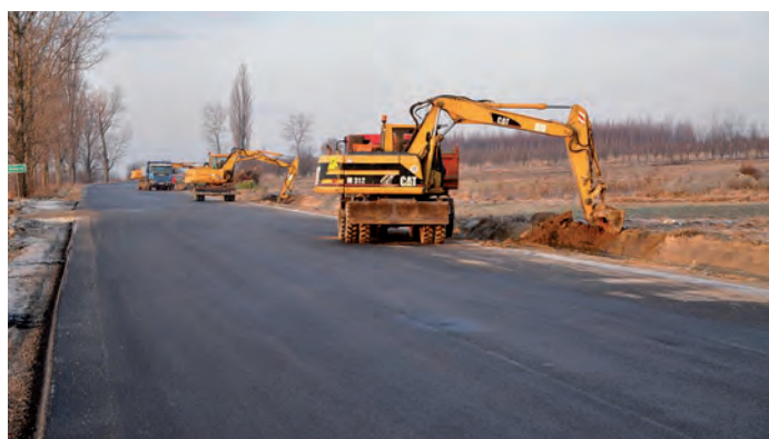
Prace modernizacyjne na drodze wojewódzkiej Chmielnik-Staszów przebiegają bez zakłóceń, 11 grudnia 2011 r.